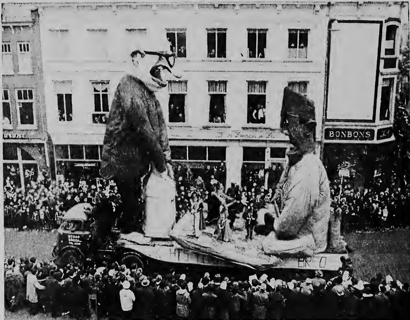
CARNAVAL NA BRENDA — Celebracion di Carnaval na Breda a mira aynan presidente De Quay y presidente Soekarno den optocht dilanti horchid di setraak.